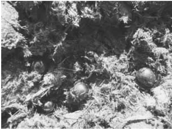
図 12 センチコガネ (糞虫)

を食べて傷つけるだけではなくて、種子を飲み込んで運んでいる。移動した先でフンをすれば、これは肥料付きの種子を散布する事と同じで、岬馬は緑を広げる役割もしている訳である。