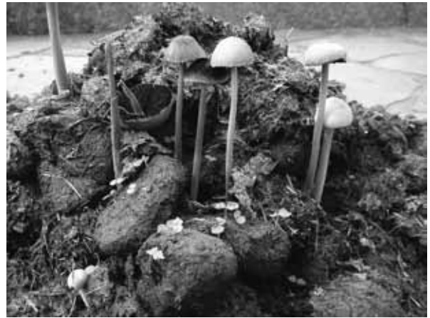
図 13 糞生菌と植物の芽吹き

都井岬は岬馬だけでなく、その土地も天然記念物として文化財指定され、保護されてきた。ゆえに都井岬には、絶滅危惧種の植物も豊富に存在している。春に咲くオキナグサを筆頭に、フナバラソウ、ボンテンカ、ノヒメユリ、ムラサキセンブリなど非常に豊富である。ここで、都井岬の絶滅危惧植物にはいくつかの特徴がある。まず一つは、馬が食べない植物であること。前述のオキナグサもキンポウゲ科の毒草であり、馬が食べないから残されている。そしてもう一つは、よく開けた日当たりの良い草原を好む、草原性の絶滅危惧植物が多いことである。