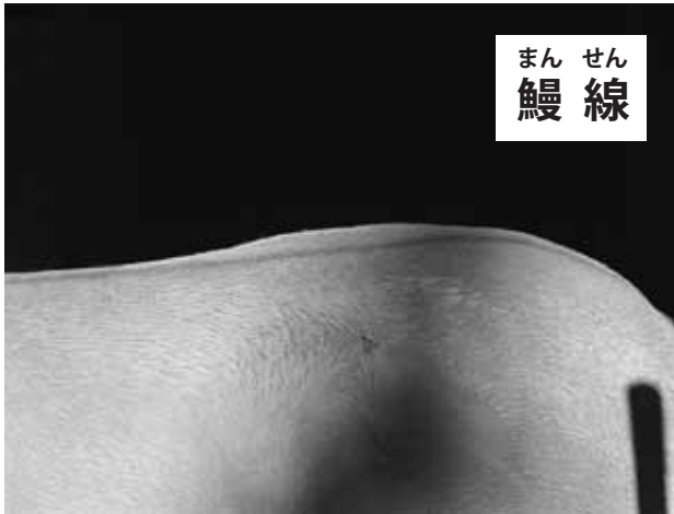
図7 モウコノウマの鰻線