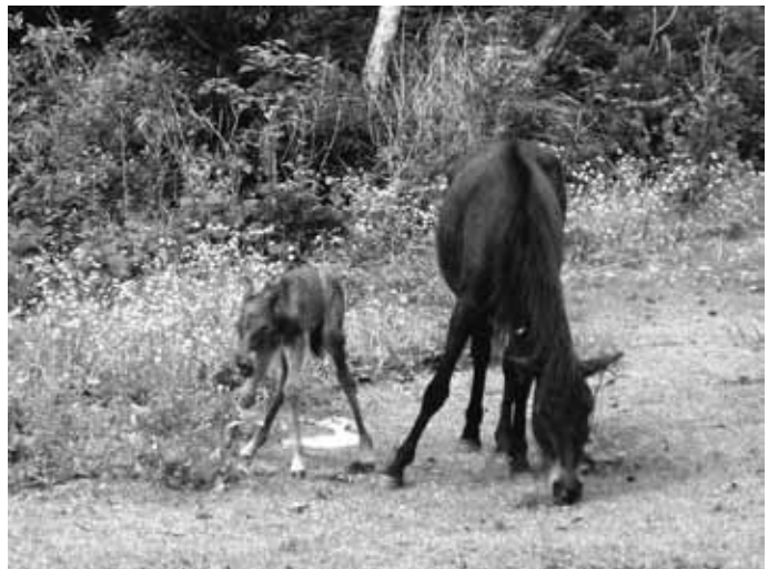
図9 生まれて間もない子馬

春は繁殖の季節であり、毎年10頭～15頭の子馬が生まれる。春に出産するのは気候が温暖で青草が豊富に生産され始める季節だからである。出産が遅れば、梅雨や夏の暑熱によって子馬が衰弱する恐れもあるため、春に出産する事は母馬にとって重要な戦略である。ここでは出産も自然分娩であるため、人間が立ち会うことはなく、すべて母馬が自分一人の力で出産して育て、それが300年以上も続いているのである。図9は、生まれたばかりの子馬が、立ち上がろうと奮闘している写真である。都井岬は本当に、命の営みを身近に感じることができる場所である。