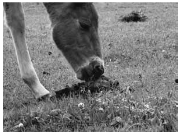
図 11 子馬の食フン行動

馬の子供は春に生まれるので『春駒』と呼ばれる。子馬は誕生から 1 時間ほどで立ち上がり、2～3 ヶ月で草を食べ始めるようになるが、生後一週間ほどの子馬を観察すると、また興味深い行動が見られる。母馬の新鮮な馬フンを見つけると、臭いを確認し、少しだけ食べるのである（図