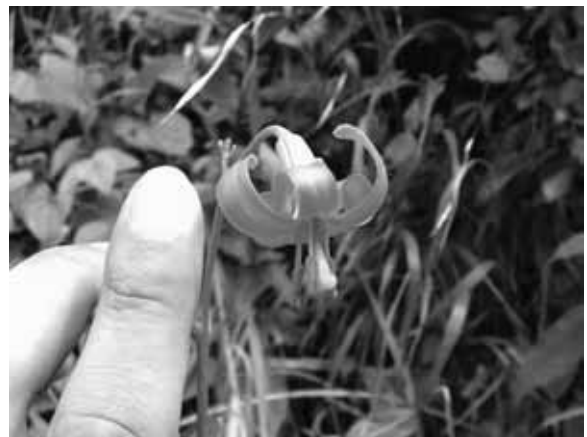
図 15 ノヒメユリ (野姫百合)