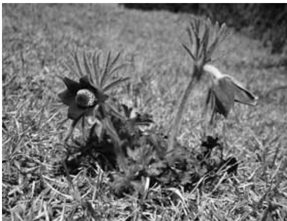
図 14 オキナグサ (翁草)

岬馬は、生重量で1日約40kgの草を食べると推計されている。全体で推計すれば、毎日約4トンの草が消えている訳で、岬馬の草原管理能力は大変なものである。逆に、それを養えるだけの膨大な草が毎日生産されているということであり、仮に岬馬が絶滅すれば、岬の美しい草原は僅か数年で深い藪に覆われてしまうと考えられる。そうなればオキナグサのように草原を好む植物は、藪に覆われて生育できない。都井岬の希少植物たちは、馬が管理する草原で、馬と共に生き残ってきたのである。