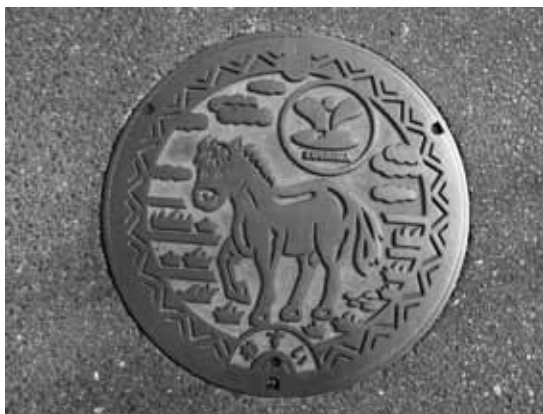
図3 馬がデザインされたマンホール

串間市には、馬をモチーフとしたデザインが街のいたる所にある（図3）、いま流行りの『ゆるキャラ』も馬のキャラクターが誕生している（図4）。そうした『馬の町』としての歴史がある場所に、