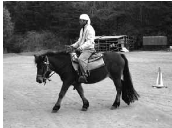
図6 乗馬に使用される木曾馬の体型

江戸時代から続く岬馬であるが、そのルーツをさらに大昔まで辿ると、また面白い話がある。日本列島にウマの骨が見られるようになるのは弥生時代からで、それより古い地層からはウマの骨が見られないことから、岬馬たちの祖先もこの頃に大陸から導入された動物ではないかと考えられている。モンゴルの大草原には、アジアの原始的な馬であるモウコノウマが生息しているが、モウコノウマの背中に注目すると、背骨に沿って色の濃い毛が生えて、タテガミから尾の付け根まで線が入るといった変わった特徴が見られる（鰻線：まんせん）。ここで岬馬の背中に注目してみると、岬馬にもこの鰻線がみられるのである。人間の蒙古斑ではないが、岬馬もモンゴル系の遺伝的影響を