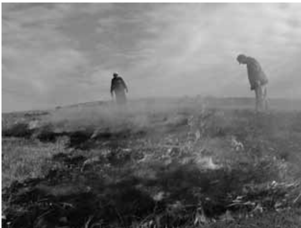
図 16 都井岬の野焼き

本来が森の国である日本では、植物の生育が旺盛である為、野焼きや草刈りなど、里山的な管理がされなければ草原は維持できない。ゆえに日本の草原は、私たちの祖先が森を開拓し、その生活の歴史と共に守られてきた環境なのである。そう考えると、都井岬の環境の全ては、ここで馬を養うという人間活動がなければ存在しなかったものであり、この都井岬の環境そのものが、地域の歴史文化であるとも言える。閉鎖された環境で、300年以上も草原が維持されてきた都井岬は、草原生態系の循環型エコシステムのモデルとしても、大変興味深い場所だ。