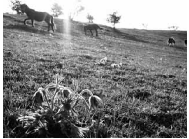
図 17 斜面に群生するオキナグサ