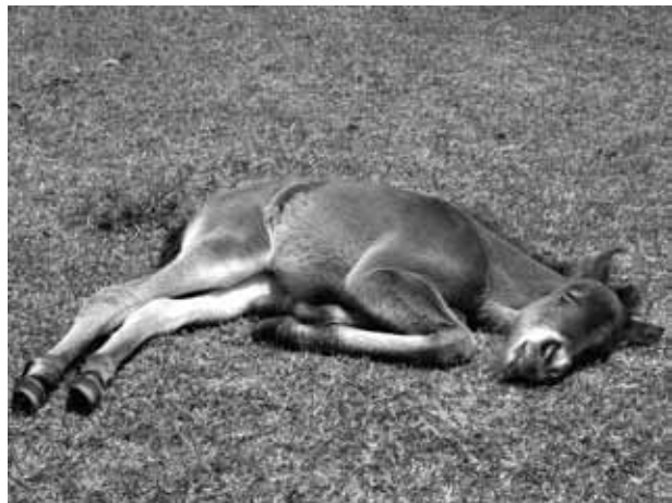
図 20 子馬の寝顔

野生化馬は少数派ではあるが、少数派だからこそ、残す価値のある馬たちだと強く感じる。私はこの都井岬で、岬馬と都井岬の価値を啓発し、発信してゆくことにより、競馬や乗馬とは異なる『第三の馬』として、野生化馬が現代社会に価値を認められる可能性に挑戦をしたいと考えている。今回の寄稿が、また多くの皆様に都井岬へお越し頂ける機会となれば幸いである。