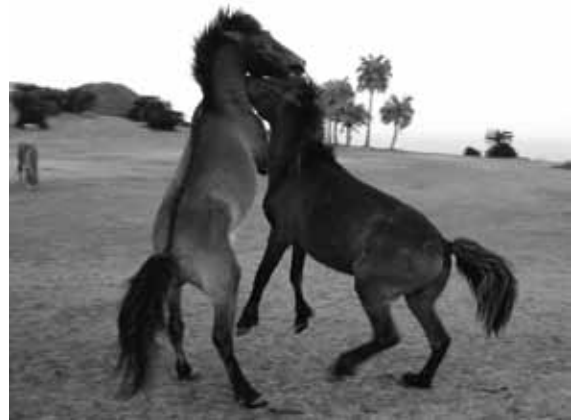
図2 雄馬の闘争行動

岬馬は、一般には野生馬と呼ばれるが、元々は家畜だった馬たちである。ウマという動物は、古くから世界中で家畜として利用されてきたため、純粋な野生動物としてのウマはすでに地球上から姿を消している（世界最後の野生馬であるモウコノウマも、野生下では一度絶滅しており、世界の動物園等で飼育されていた個体を野生に戻す試みが続けられている）。アメリカ大陸のマスティングなど、野生馬と呼ばれるウマは海外にもあるが、これらも厳密には家畜から野生に戻って『再野生化』をした馬である。都井岬も、江戸時代に高鍋藩の軍馬の生産牧場として始まったと伝えられる。現在では、串間市内で馬の群れが見られるのは都井岬だけであるが、江戸時代の串間には80ヶ所以上の牧場があり、6千頭を超える馬たちが居たと伝えられ、大変な馬産地であったようだ。