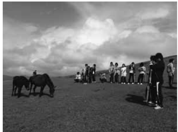
図19 野生馬の観察（宮崎大学農学部）

動物行動学や草地生態学の野外講座で、都井岬を訪れることが恒例となっている（図19）。