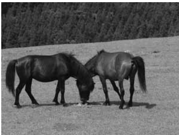
図 10 互いのフンを確認する雄馬

繁殖期の岬馬は、他にも興味深い行動を見せてくれる。雄は、自身のハーレムに属する雌の排泄物を見つけると、臭いを確認し、そこへ自身の尿をかけるという大変奇妙な行動をする。雌の排泄物中には、繁殖に関する臭いの情報が含まれていると考えられ（発情しているか等）、この情報を公開しておけば、周辺の雄が狙って浮気をかける心配がある。事実、近年は岬馬の血液を採取して遺伝子を解析し、父親と子供の関係を調査する研究も行われているが、群れで生まれてくる子馬がハーレム雄の実子である割合は、全体の 7 割程度という結果がある。他の 3 割は浮気が成立しているという事で、雄は臭いの強い『雄の尿』を使って、雌の情報を必死に隠蔽しているのではないかと考えられている。