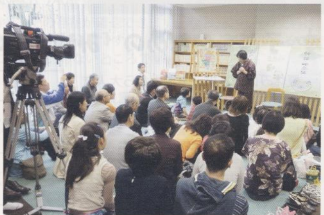
〈こどもの読書週間行事「神話の読み聞かせ」の様子〉

宮崎県立図書館が、人づくり・地域づくりに役立つ図書館として、積極的に活動している「動」の姿勢を、ビジュアル的に表現したものです。