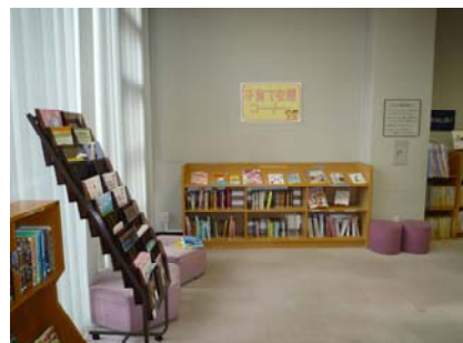
(「子育て支援コーナー」の様子)

皆様どうぞお立ち寄りください。お待ちしております。（開館時間は午前9時から午後5時までとなっています。）