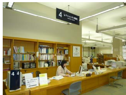
(レファレンスカウンターの様子)