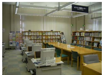
(「ビジネス情報コーナー」の様子)

また毎週木曜日には産業支援財団のコーディネーターによる「ビジネス相談会」も開催しています。ぜひビジネスをお考えの方、県立図書館をご利用ください。