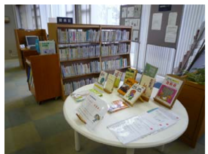
(「健康情報コーナー」の様子) 07.

また、毎週土曜日（午前10時から午後4時）には、宮崎県看護協会の会員による健康相談会「まちの保健室」を開催しています。心身の健康、生活習慣病予防、栄養指導、介護・療養生活に関すること等の相談に応じております。ぜひご利用ください。